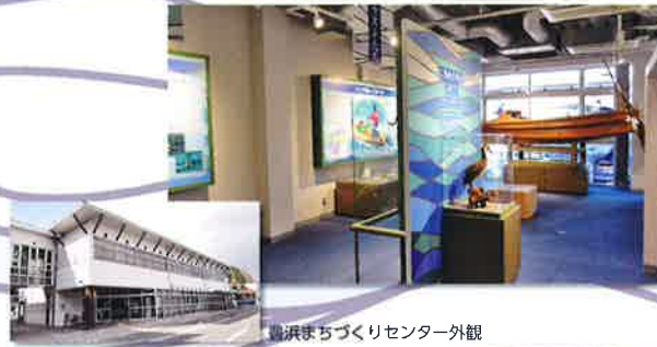
豊浜まちづくりセンター外観