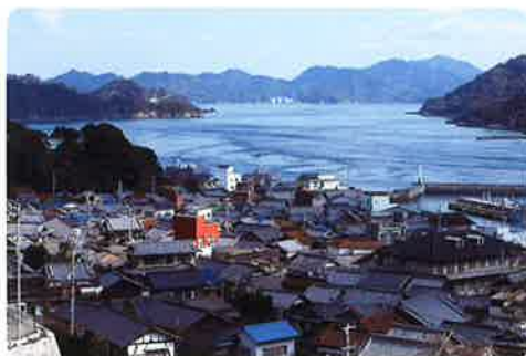
▲麓（いらか）越しに見える美しい島影。