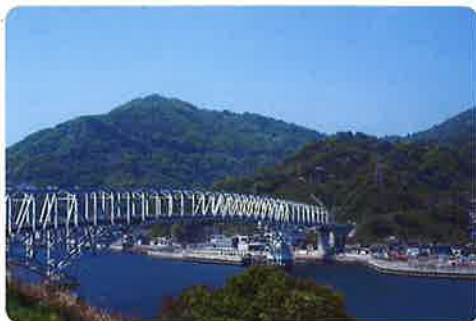
▲青い空と海に映える、銀色の豊浜大橋。

小さな島のため坂が多いですが、高台からの眺めは美しく、季節や天気によって変わる海の色は、何度も訪れてご覧いただきたい島の魅力です。